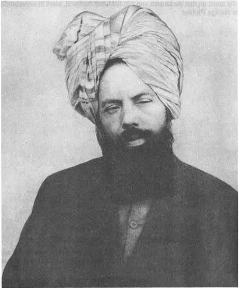
Mirza Ghulam Ahmad van Qadian 1835–1908 De Beloofde Messias en Mahdi Hervormer van de veertiende eeuw hidjra