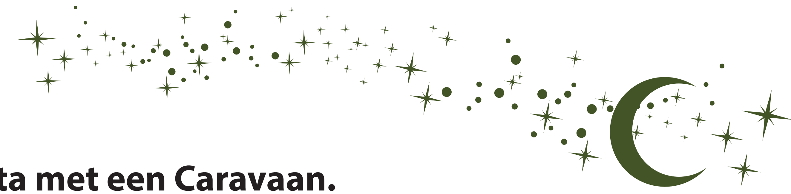
Illustratie uit Rihla. ibn Battuta met een Caravaan.

Ibn Battuta liet zijn reizen opschrijven in een boek getiteld Rihla of te wel "De Reis". Er waren maar een paar overleveringen van zijn boek bekend, maar in de 19e eeuw (1818) werd het heel boek gevonden en in 1853-1858 werd zijn levensverhaal in het Arabisch en Frans gepubliceerd. Na de publicatie van zijn boek werd Ibn Battuta een bekend figuur in zowel de Islamitische wereld als de Westerse wereld. Ook de luchthaven van Tangier is naar hem genoemd. Ibn Battuta reisde meer dan 121.000km in bijna 30 jaren. Onderweg heeft hij gewerkt als rechter, vertaler, leerkracht, onderhandelaar en ambassadeur. Hij is aangevallen door bandieten en piraten, gegijzeld door een koning en ontvoerd door een andere koning. Hij is uitgehuwd aan een Princes op de Maldiven. Hij heeft kannibalen ontmoet in west-Afrika en gelogeerd bij Egyptenaren die woonde in China. Hij heeft de Hadj 7 keren volbracht.