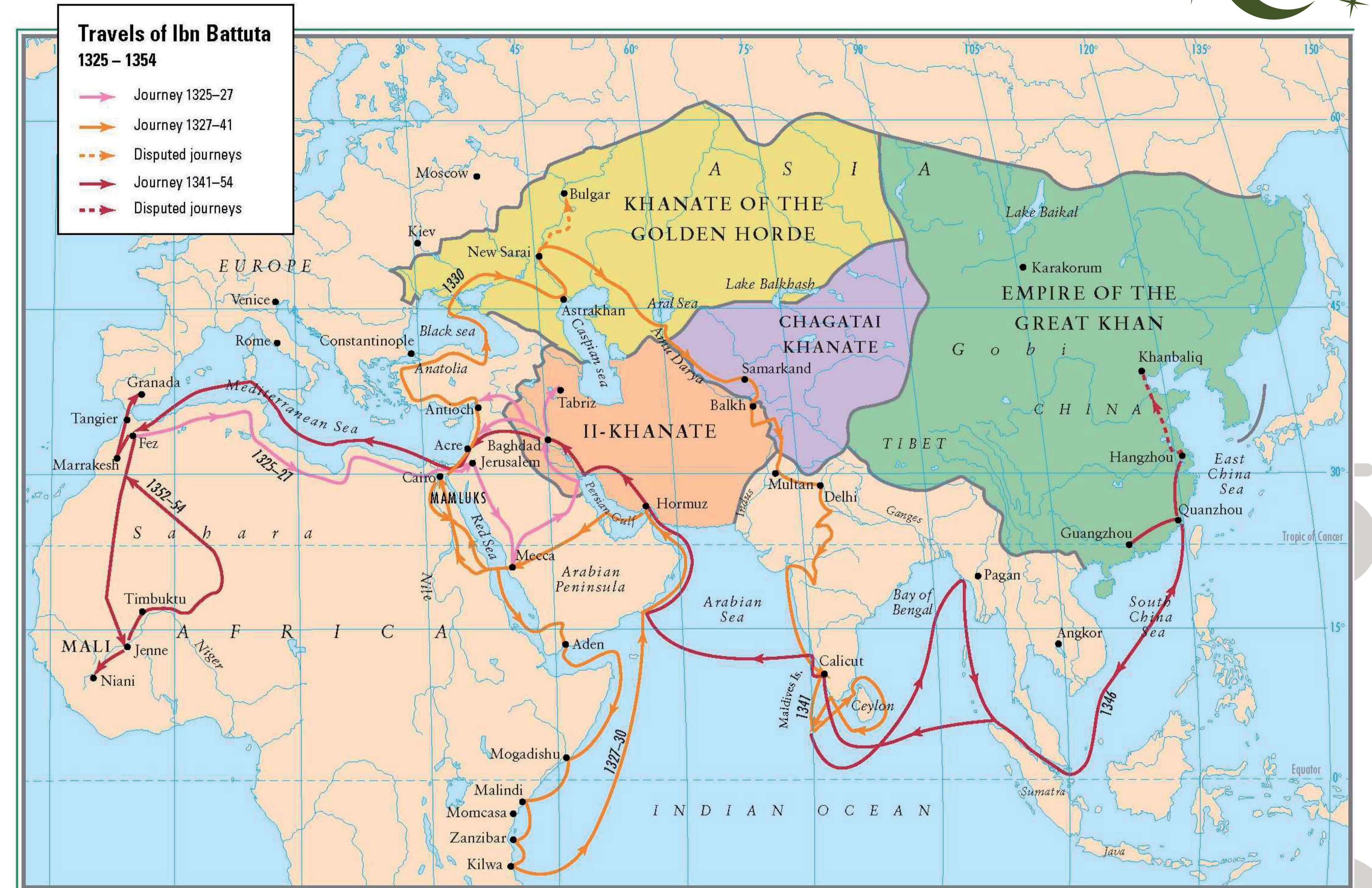
Reizen van Ibn Battuta 1325-1354 CE