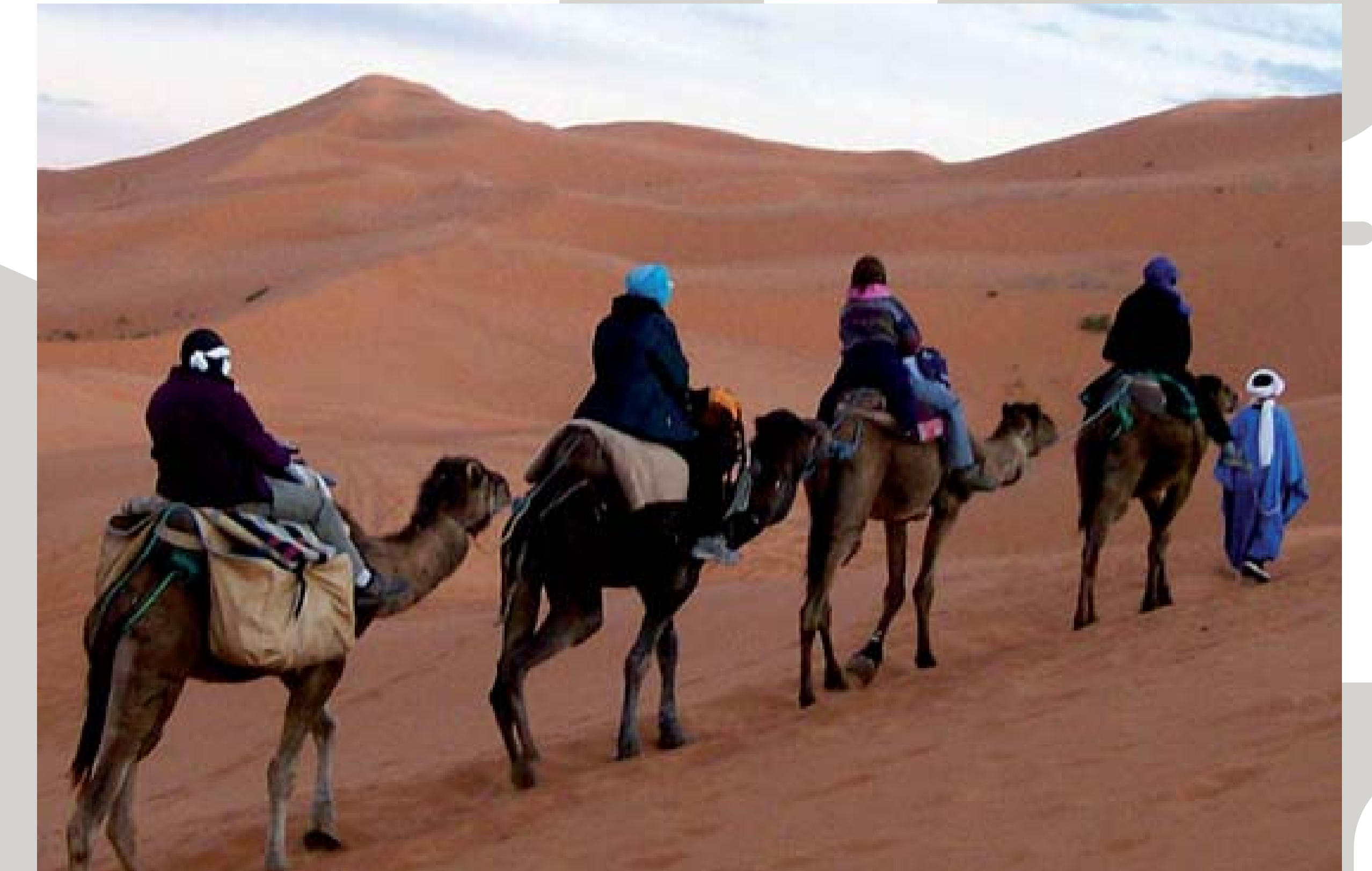
Handels caravan met kamelen. Zoals in de tijd van Ibn Battuta