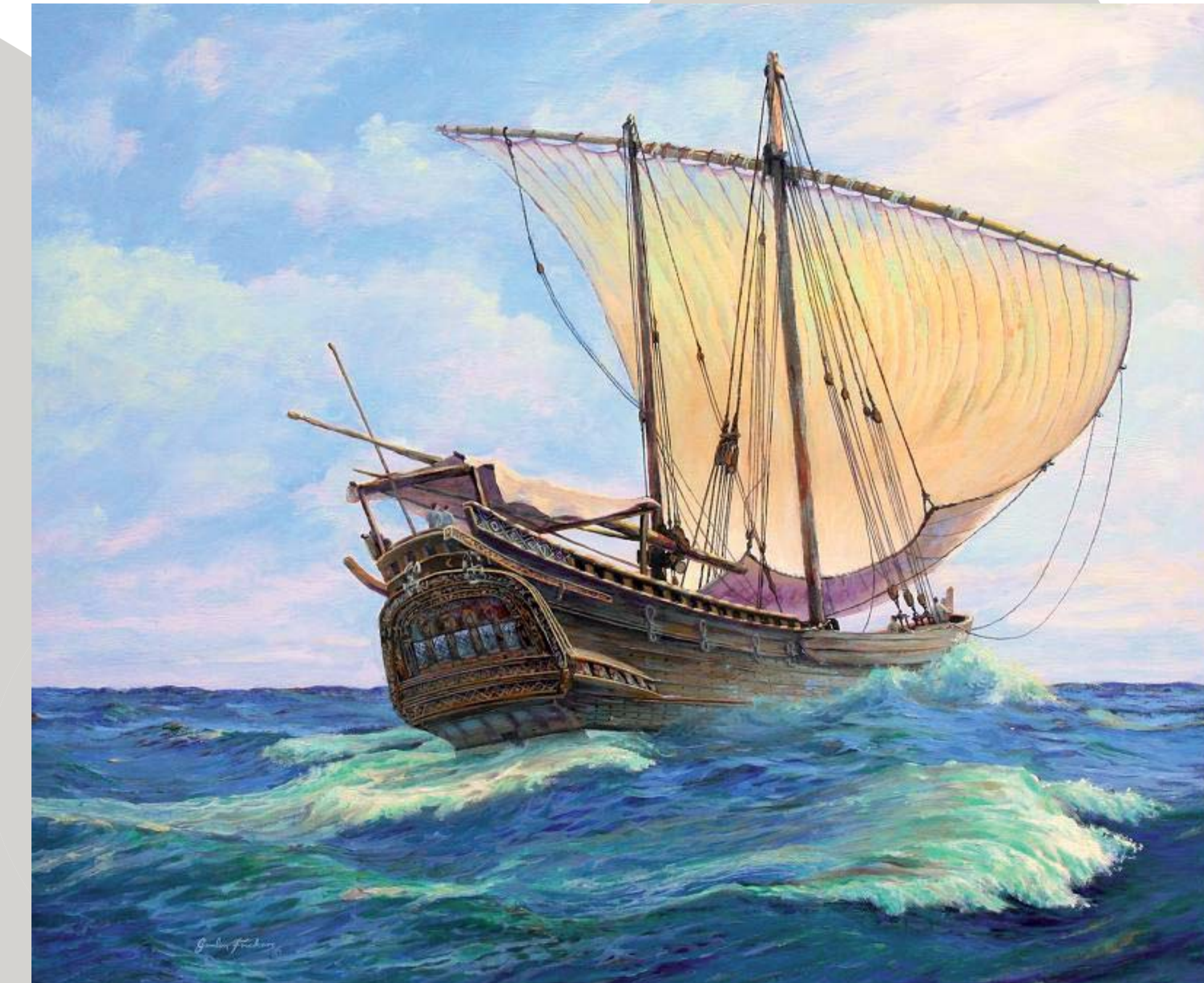
De Dhow. Handelsboten van moslims in de Indiase zee zoals Ibn Battuta zou hebben gebruikt