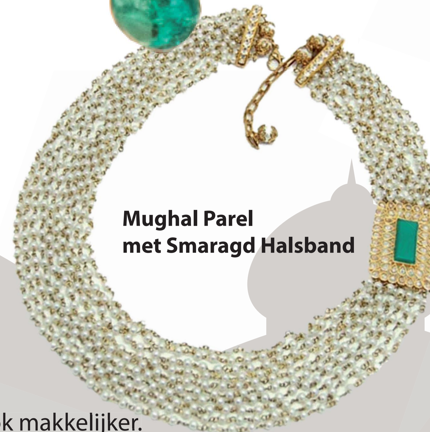
Mughal Parel met Smaragd Halsband