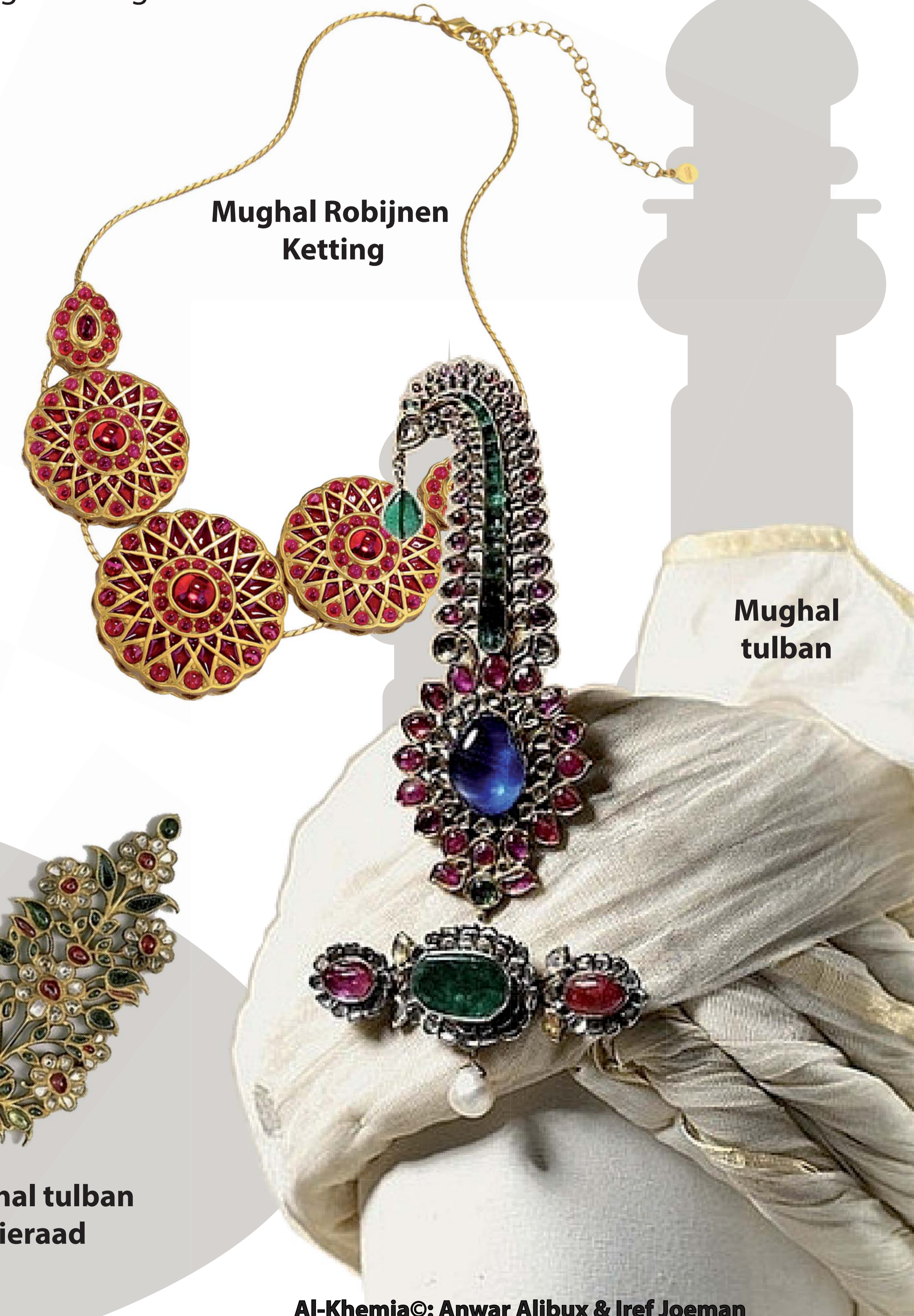
Mughal Robijnen Ketting