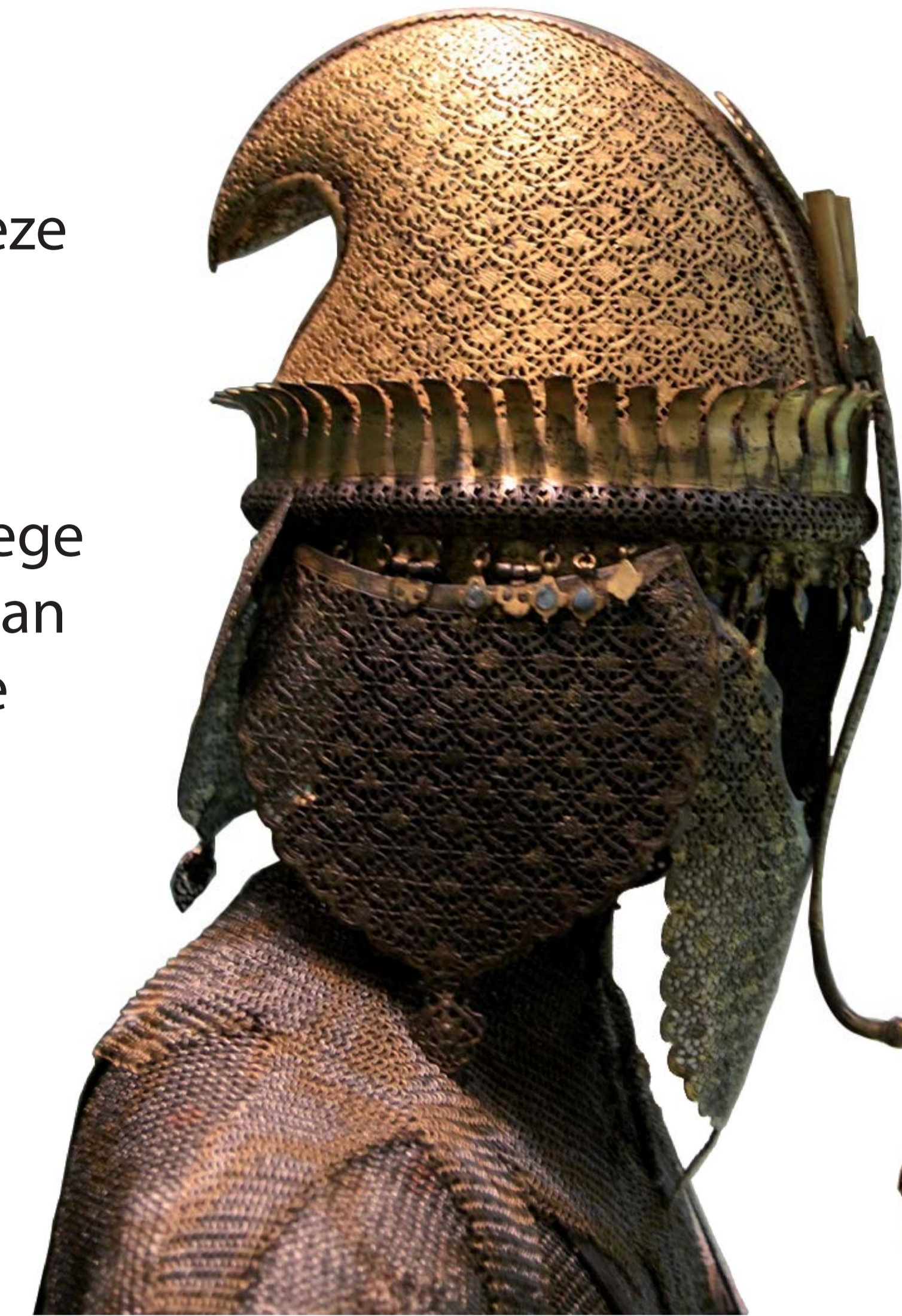
Mughal Elite Panser. Ketting mail met helm. 17de eeuw.

6. Aurangzeb geboren op 4 november 1618 en stierf op 3 maart 1707, regeerde vanaf 1658 tot 1707. Hij was de zoon van Shah Jahan en Mumtaz Mahal, hij was tevens ook de Keizer van de Grootste Mughal Rijk. Na Aurangzeb ging de Mughal Rijk ook achteruit en wordt daarom ook de laatste Grote Mughal heerser genoemd.