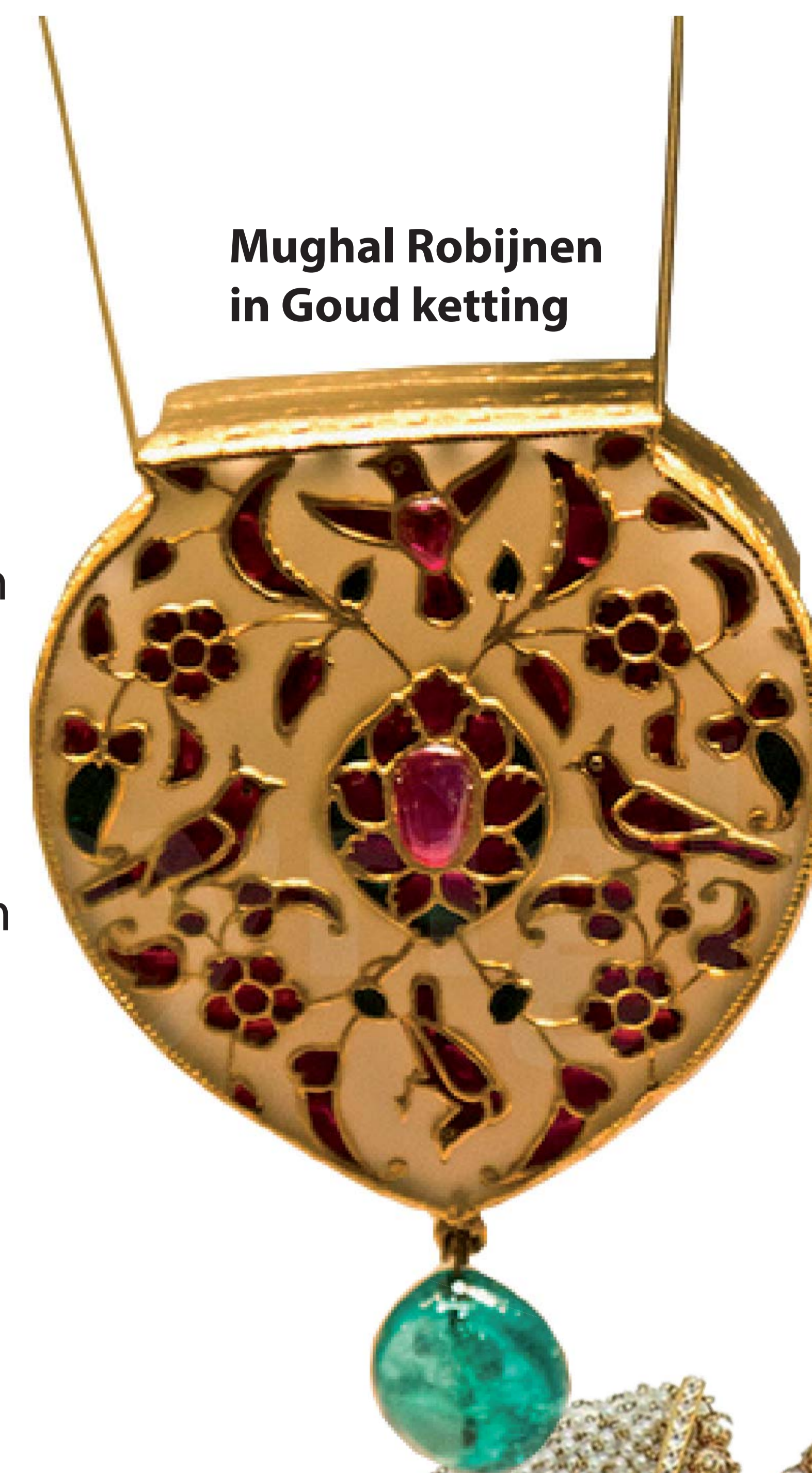
Mughal Robijnen in Goud ketting