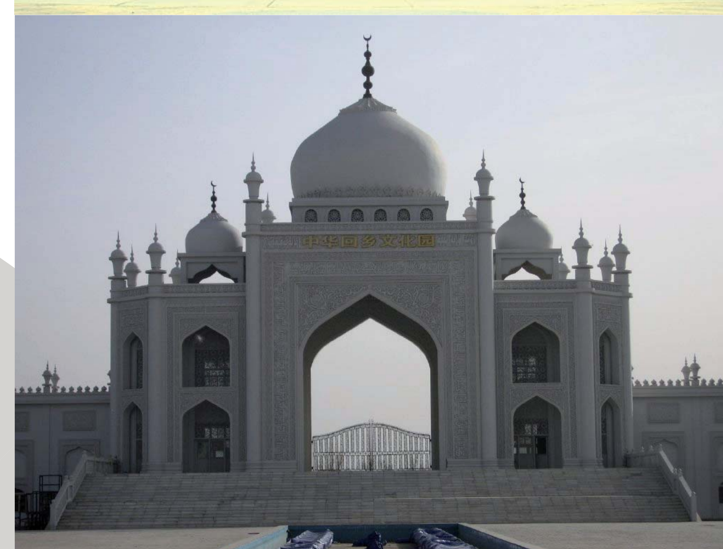
Hui Moskee in Ningxia - China