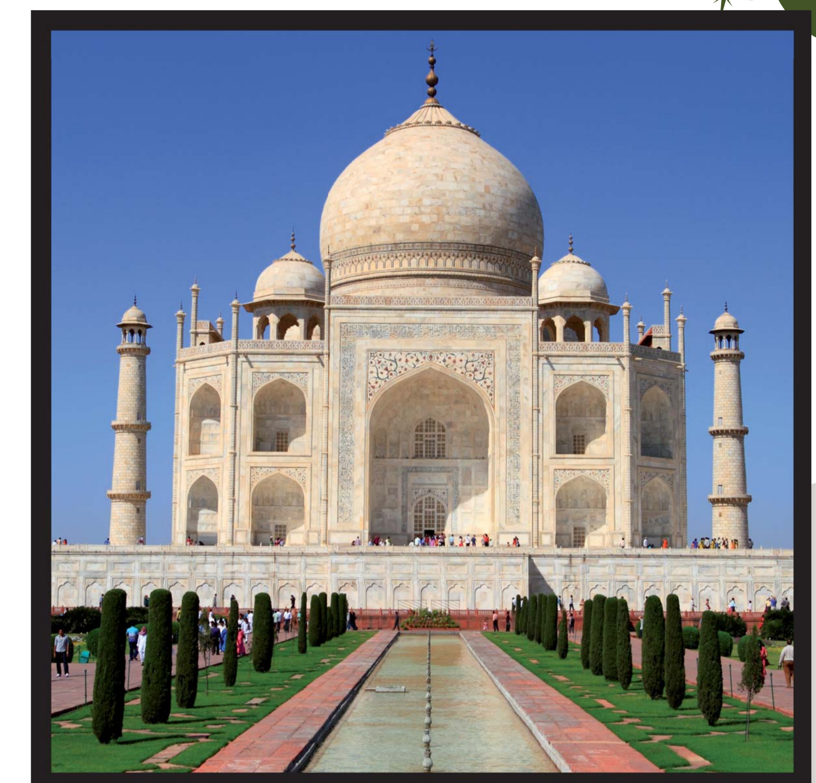
Taj Mahal, India. Een mosuleum