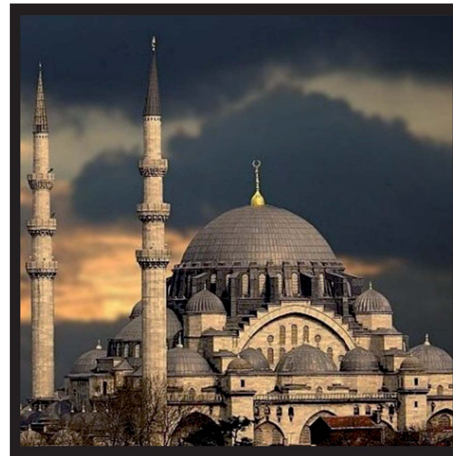
Suleiman Moskee, Turkije