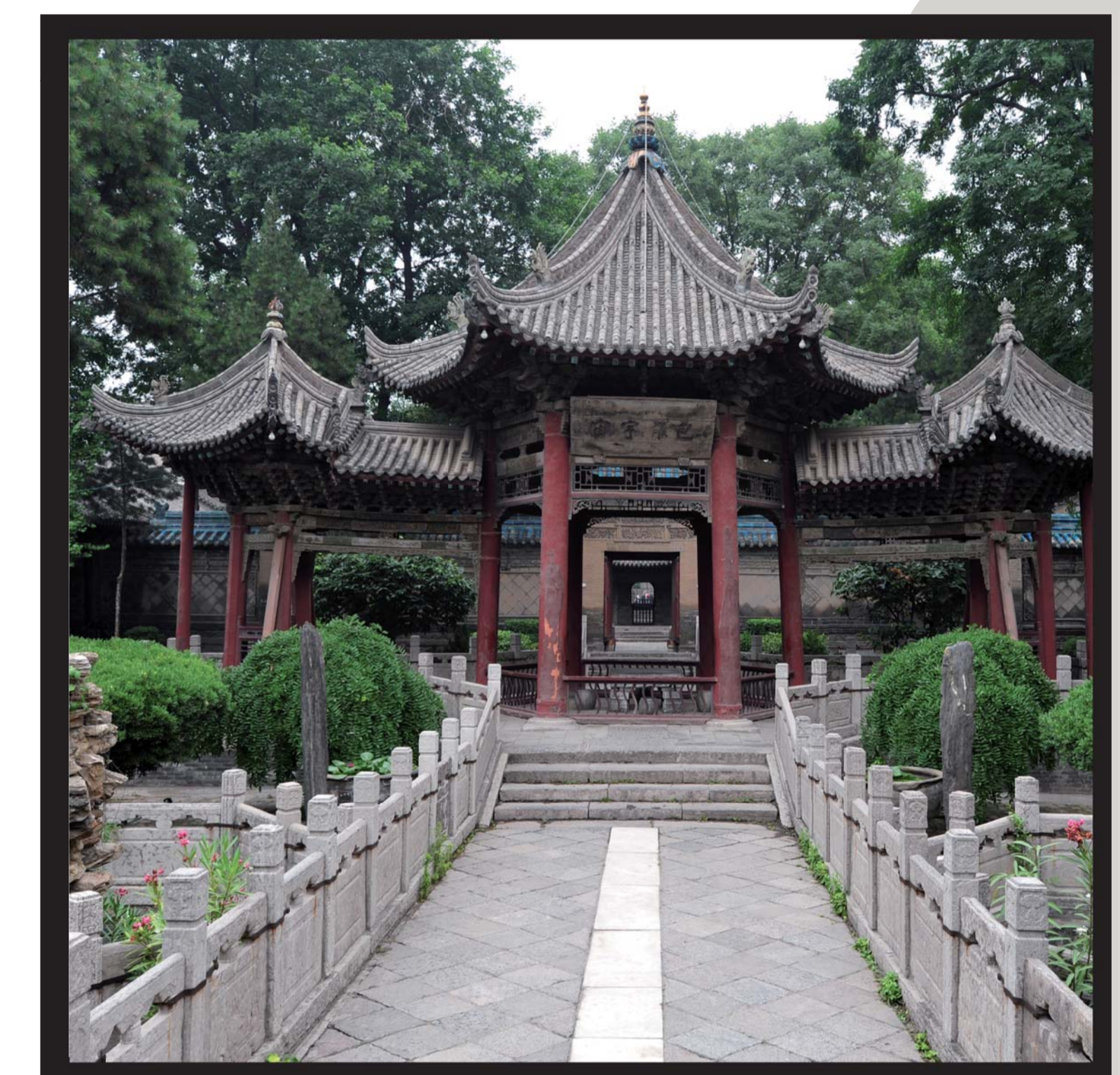
Xi'an Moskee, China

“De Islamitische architectuur heeft vele invloeden gekend zoals de Egyptische(Nubia), Byzantijnse, Romeinse, Mesopotamische, Indiase en Perzische. Hierdoor is er tijdens de rijke culturele geschiedenis van de vele Islamitische rijken een unieke vorm van kunst en architectuur ontstaan.”