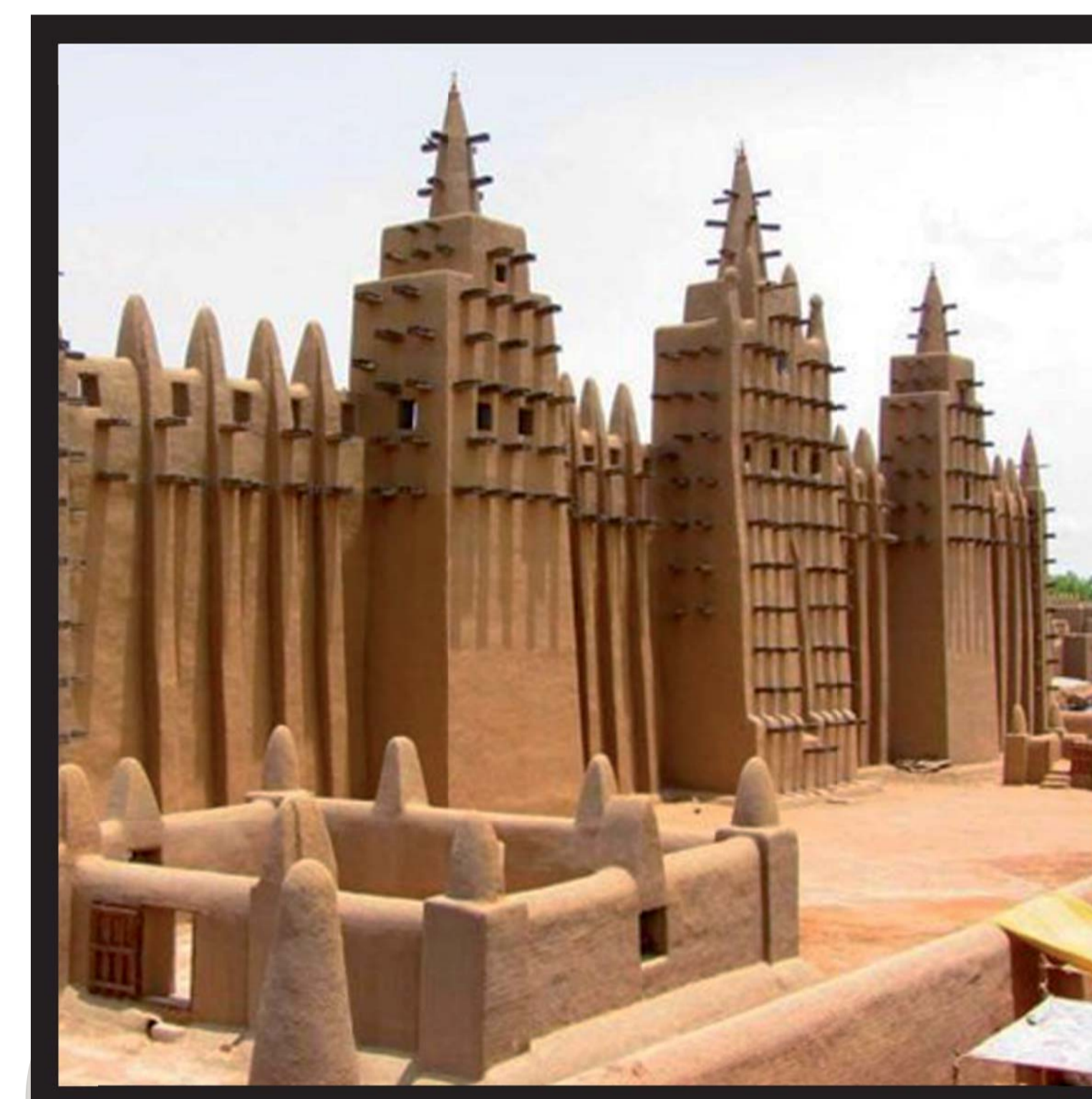
Djenne Moskee, Mali (West Africa)